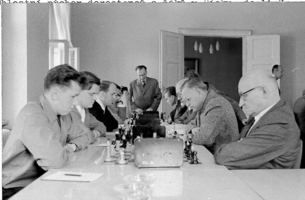
Záběr z posledního utkání se šachisty ze Schwarzheide.