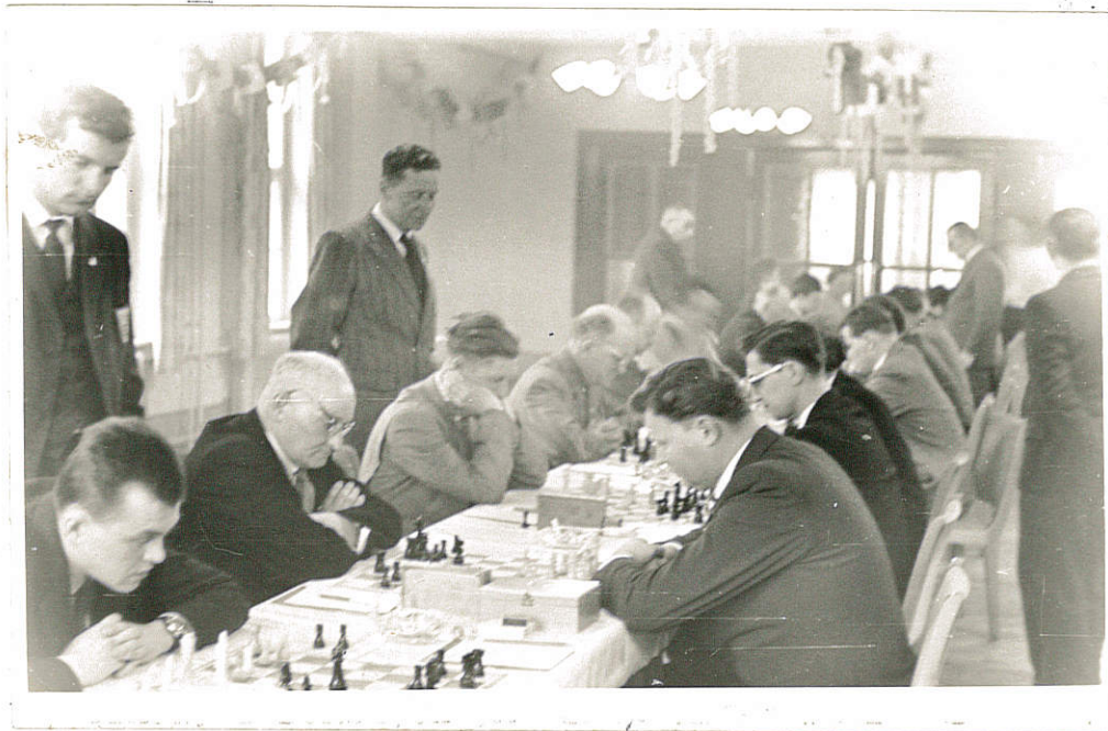
Z utkání tábořských šachistů ve Schwarzheide NDR.

Z mezinárodního utkání v rámci družby s NDR