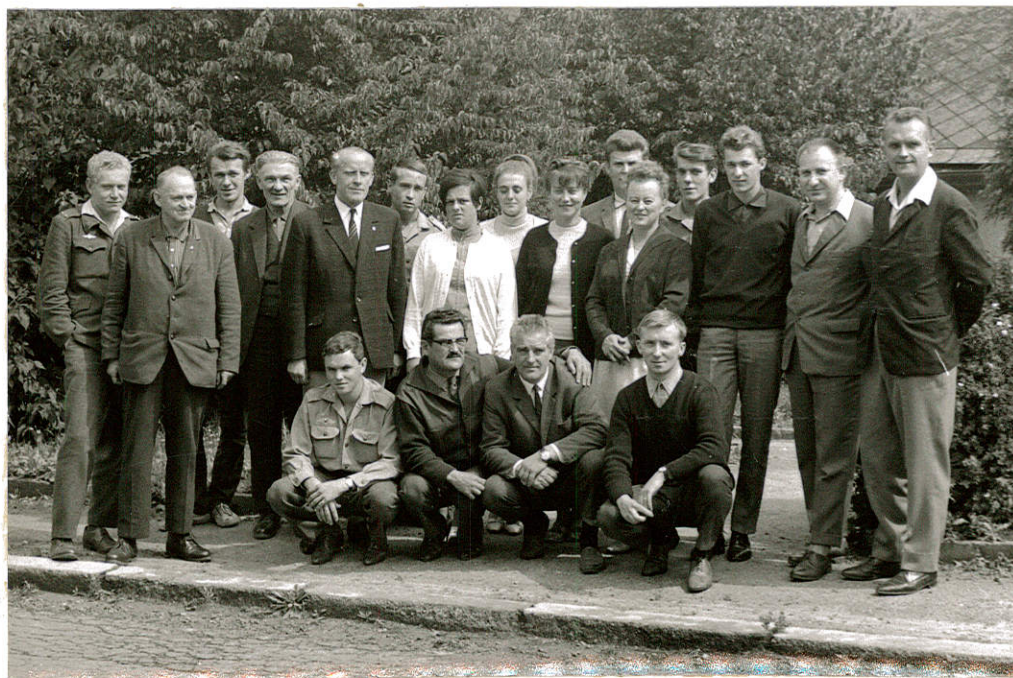
Účastníci krajského přeboru v Humpolci 1968

Koeficient 1,16 Norma I.VT 6 1/2, II.VT 3 1/2 bodu