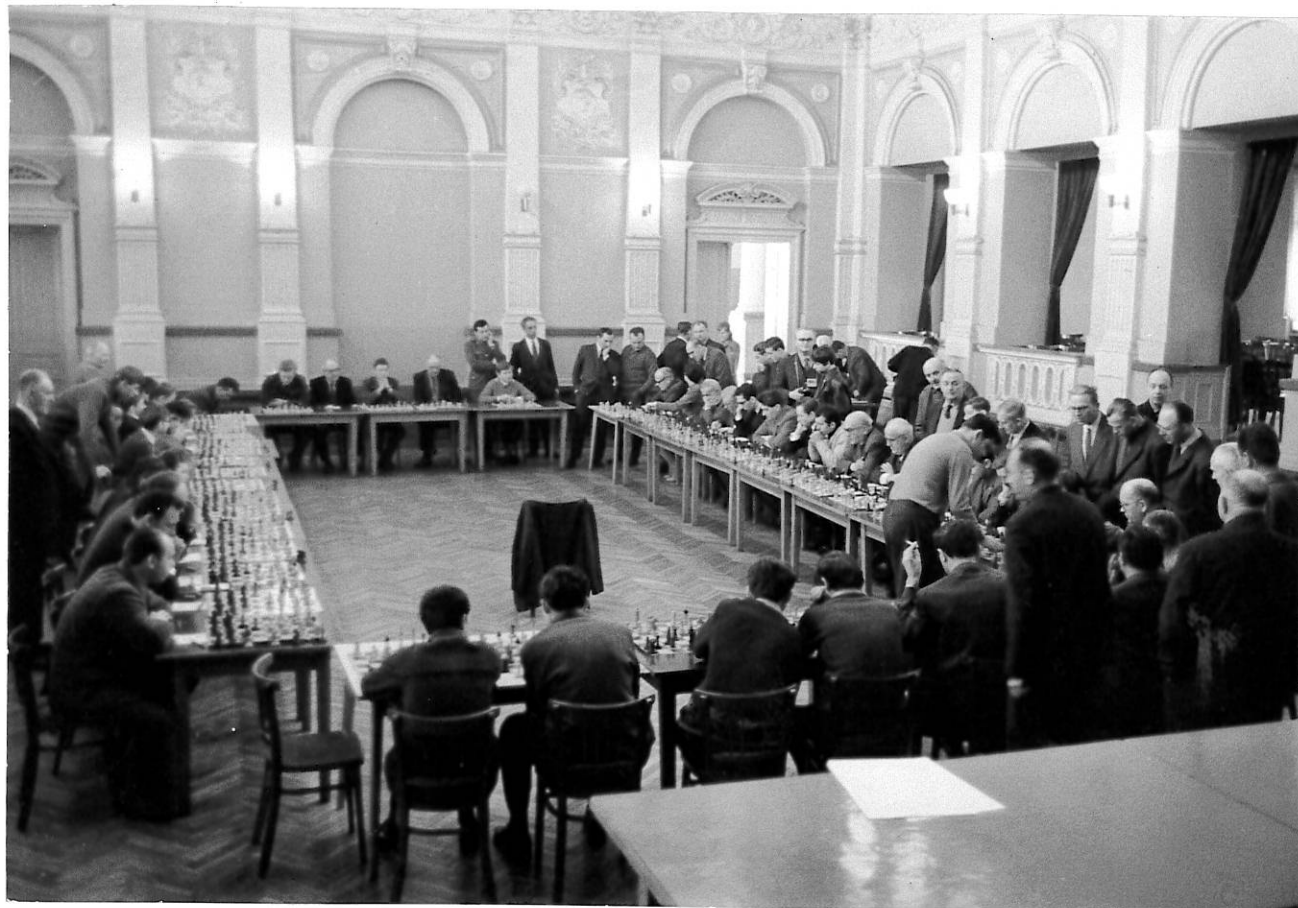
Simultánka velmistra Vlastimila Horta 24.3.1968 v Táboře