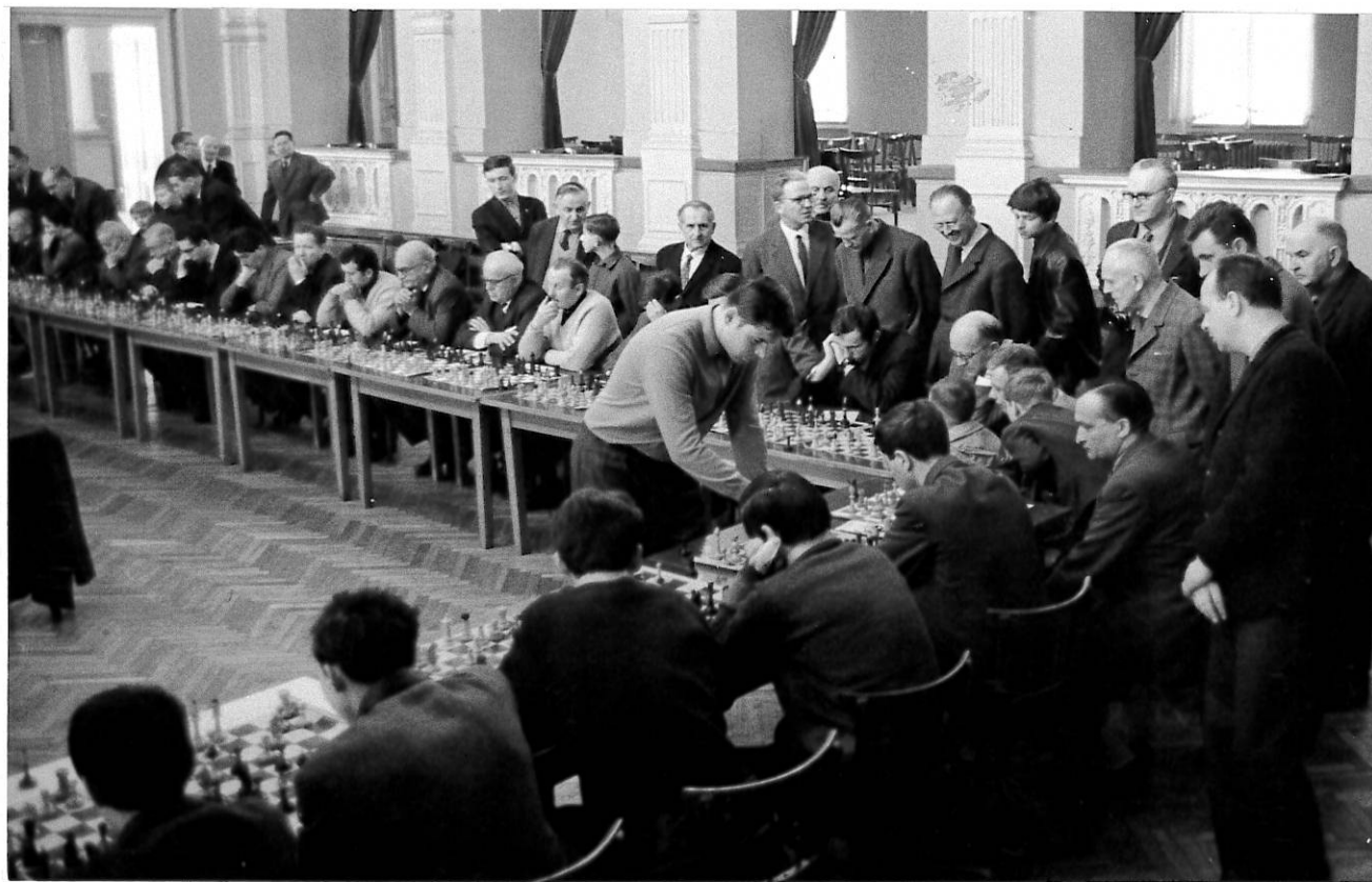
Simultánka velmistra Horta na Střelnici v Táboře 1968