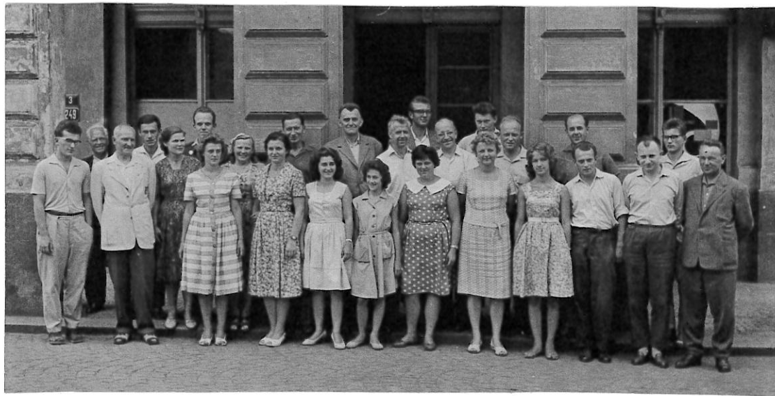
Krajský přebor mužů a žen, který se konal na Střelnici v Táboře v roce 1962, soustředil kromě mužů i hodně žen. Byl to již pátý krajský přebor uspořádaný tábor- skými šachisty po sjednocené tělovýchově v roce 1952. Celkem uspořádal Tábor v letech 1929-1980 čtrnáct krajských přeborů.

"Dajž to Jezu Kriste králi, abychom zde tak šachy hráli a potom se do věčné radosti dostali!"