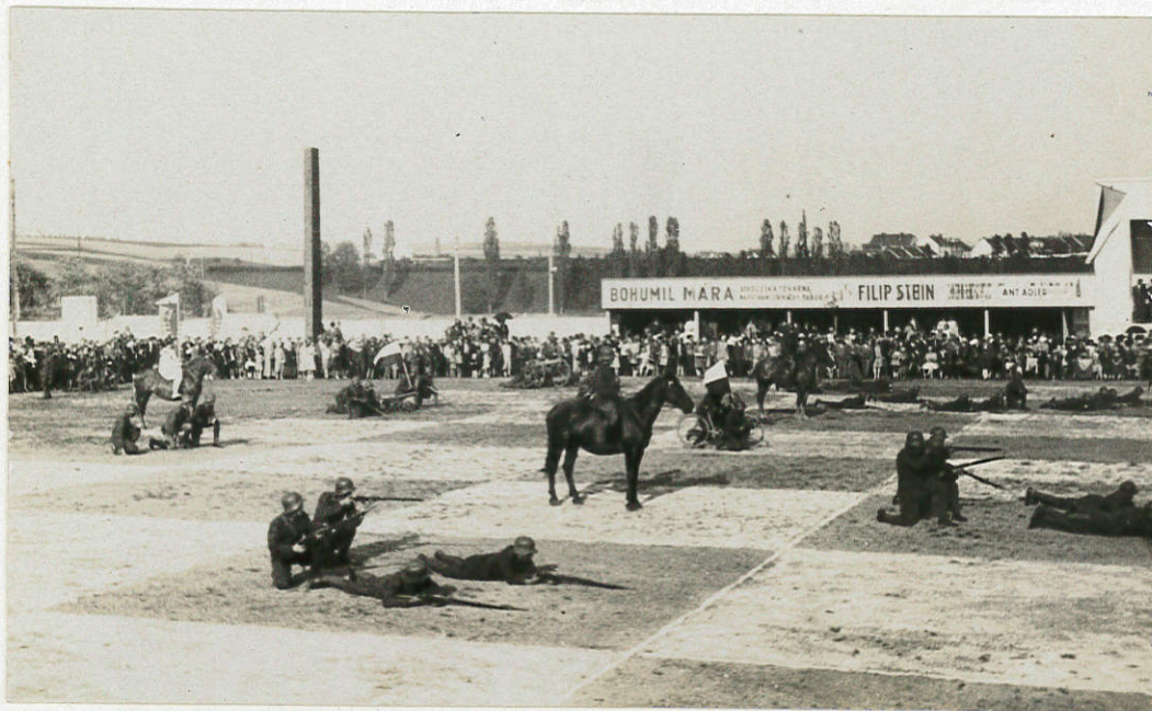
Záběr z průběhu boje.