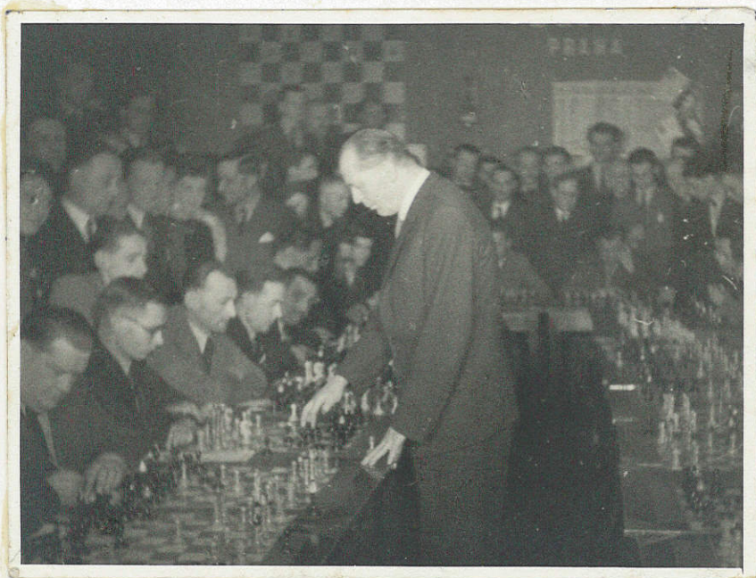
Velmistr Oldřich Duras hraje simultánku u příležitosti sjezdu jihočeských šachistů a živé šachové partie v Táboře v roce 1929. Bylo to jeho jedno z posledních vystoupení.