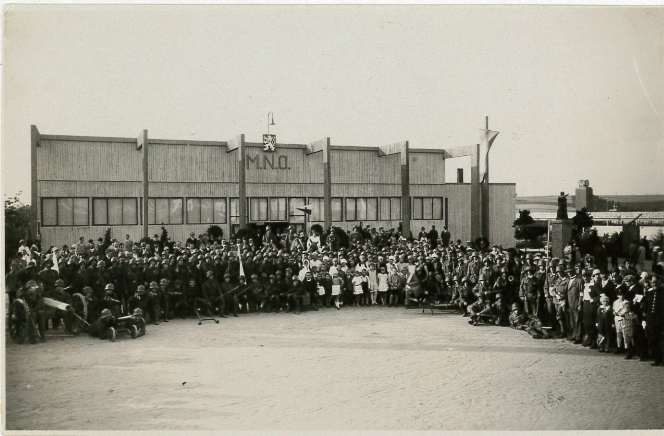
Živá partie "BITVA U ZBOROVA" na libreto mistra Karla Traxlera, kterou uspořádal Tábořský spolek Fiala za účasti vojska, legionářů, studentů, kulturních a tělovýchovných korporací ve dnech 13-14.července 1929 na Stadionu v Táboře byla jedinečnou šachovou atrakcí. Pro velký zájem veřejnosti byla scéna ve dnech 3-4.srpna opakována. Na fotce účast před zahájením.