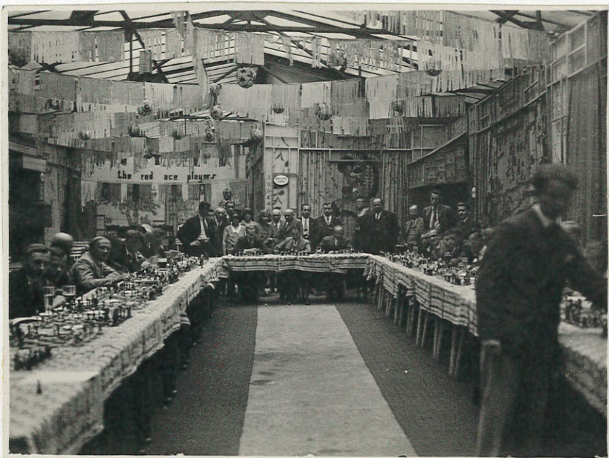
Také velmistr Salo Flohr hrál v Táboře simultánku v jeho mladších létech 26.6.1931.